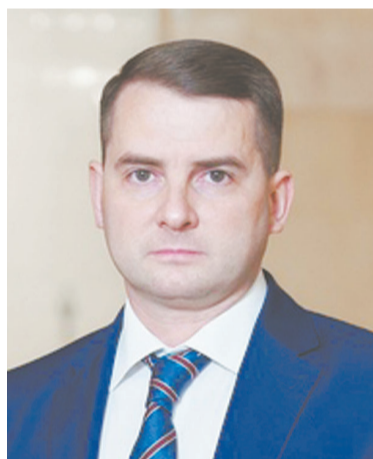
Ярослав Нилов, заместитель руководителя фракции ЛДПР в Госдуме

Депутаты предложили установить сумму при рождении третьего ребёнка в том же размере, что и при выплате на первого — 503 237,10 рублей с 1 января 2022 года и распространить его на ранее не воспользовавшихся правом на государственную поддержку мужчин, которые являются единственными усыновителями третьего ребёнка, четвёртого или последующих детей.