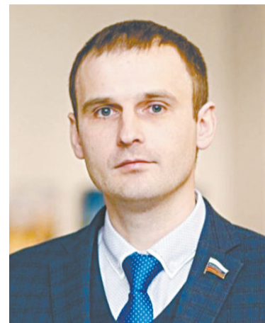
Сергей Леонов, депутат фракции ЛДПР в Госдуме

Депутат фракции ЛДПР в Государственной Думе, врач-иммунолог Сергей Леонов направил министру здравоохранения Михаилу Мурашко предложение о создании в РФ дополнительного регистра граждан, у которых имеются антитела к коронавирусу.